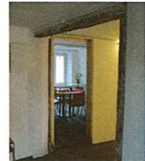
In den grosszügig bemessenen Räumen des neuen Musikschulhauses – rechts: Handlungsbedarf im Rebbauernhaus

Die provisorische Abrechnung über den Ersatz-Neubau liegt vor. Wir haben mit einer Kostenüberschreitung gegenüber dem Voranschlag von rund 5% zu rechnen; Hauptkostentreiber war dabei die Sanierung der Kanalisation und der Einbau einer neuen Pumpe. Die Kosten für die Bauherrenbegleitung bewegen sich im budgetierten Rahmen - dies gilt auch für den Aufwand für das bei AMZ in Auftrag gegebene Vorprojekt für die Sanierung des Rebbauernhauses .